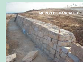
MUROS DE BANCALES