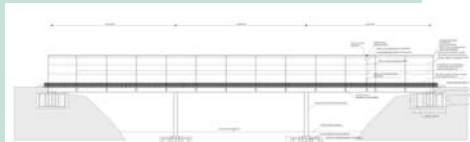
PASARELAS DE ISLAS