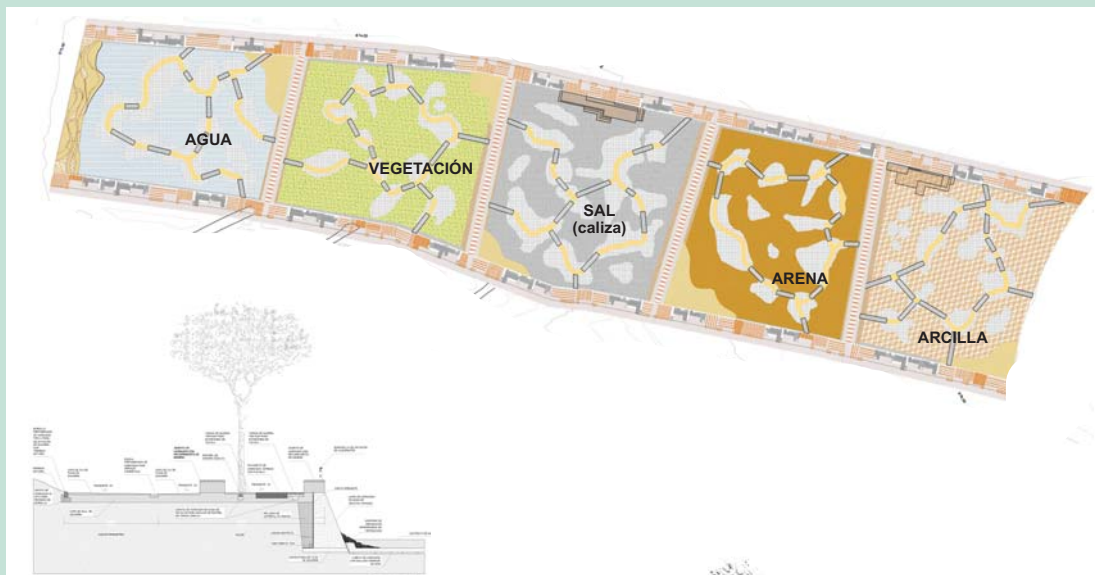
SECCIÓN DE PASEO, SALÓN Y MURO DE CUBETA